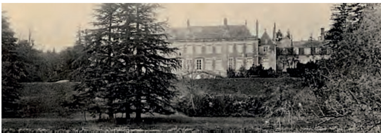
Le château avant 1903, archives municipales d'Orléans - Collections ND. Phot.